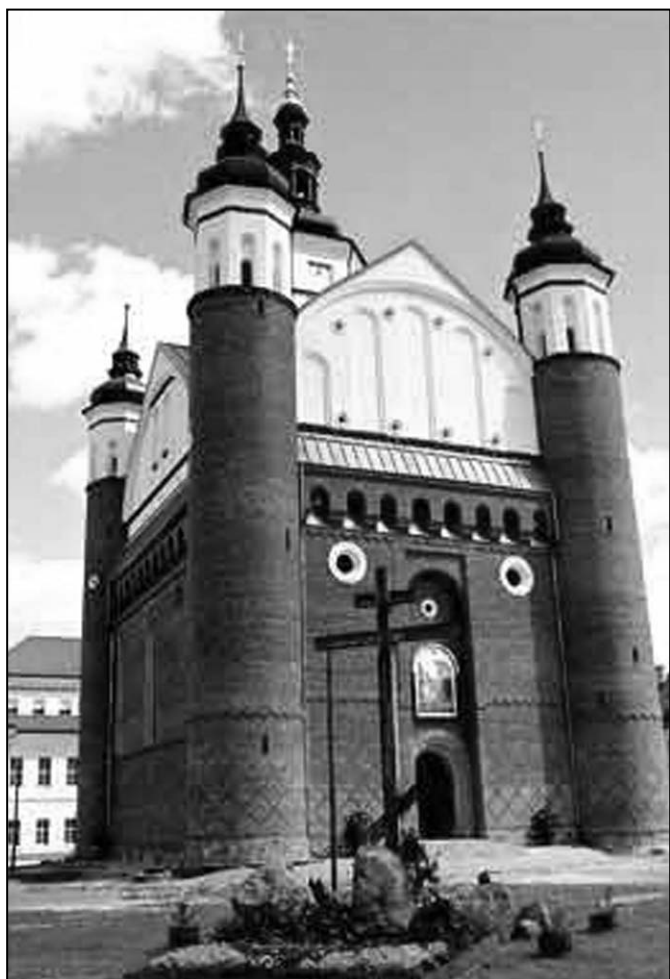
(începutul în pag. 1)

Din păcate, aceasta era imposibil de atins în forfota și zarva care caracterizau împrejurimile unui centru administrativ unde fuseseră strămutați, special, locuitori din Rusia și nobili din Mazowsze, astfel încât mulți călugări au preferat să se întoarcă de unde au venit, în timp ce alții au început să caute un spațiu mai potrivit pentru o mănăstire. Legenda spune că a fost aruncată în râul din zonă o cruce din lemn, hotărându-se ca acolo unde se va opri să fie locul pentru viitorul complex monahal. Astfel, în anul 1500, în regiunea care purta numele Suchy Hrod (Suchy Grad), s-au pus bazele așezării cu numele Suprasl. Zona era foarte potrivită, fiind departe de zgomotul așezărilor omenesti și prezentând și avantajul unei excelente poziționări defensive, înconjurată de râuri și de mlaștini greu de străbătut.