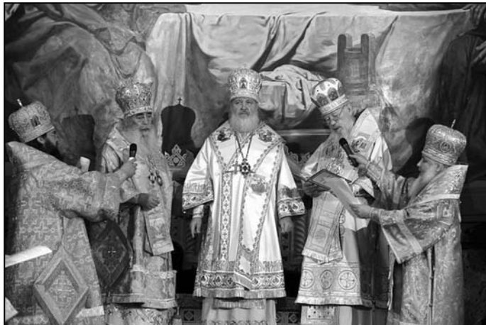
Moscova. Intronizarea Patriarhului Kiril

În perioada 25-29 ianuarie la Moscova și-au desfășurat lucrările Soborul Arhieresc și Sinodul Local al BO Ruse. Întrunirile au fost determinate de văduvirea scaunului Patriarhiei Moscovei în urma trecerii la Domnul a SS Alexei al II-lea la 5 decembrie 2008. A fost formată o comisie specială, care a pregătit convocarea Soborului Local pentru alegerea noului Întâistătător.