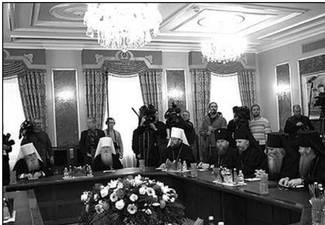
Secvență de la Ședința Sfântului Sinod al Bisericii Ortodoxe Ruse

ÎPS Vladimir s-a deplasat la Moscova unde a participat la Ședințele Sinodului Arheresc și a celui Local al Bisericii Ortodoxe Ruse.