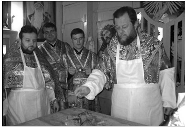
Sfințirea bisericii de iarnă de la mănăstirea "Ciuflea"

Mitropolitul Vladimir a oficiat slujba de sfințire a