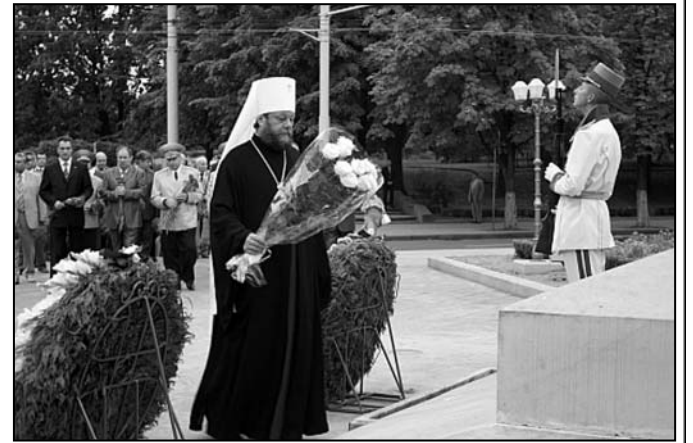
Față Mitropolitul Vladimir a liturghisit la Catedrala Mitropolitană.

De sărbătoarea împărătească Schimbarea la