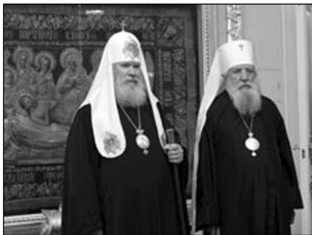
Patriarhul Alexei al II și mitropolitul Lavru

În data de 17 mai a.c., în Catedrala „Hristos Mântuitorul” din Moscova va fi semnat, de către patriarhul Alexei al Moscovei și a toată Rusia și mitropolitul Lavru, primat al Bisericii Ortodoxe Ruse „din afara granițelor țării”, actul oficial prin care se consfințește restabilirea unității canonice a Bisericii Ortodoxe Ruse, prilej cu care vor avea loc câteva manifestări, informează egliserusse.typepad.fr. În acest sens, mitropolitul Lavru va sosi, la orele 09.15, la Catedrala, unde