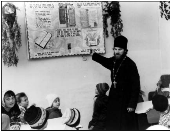
La ora de religie

dar metodele clasice cuprinse în programa școlară nu îndeamnă spre chemarea lui Hristos: mergi și fă și tu la fel! Disciplinele școlare oferă elevului cunoștințe, dar nu-l fac înțelept. Avem mulți oameni învățați, dar mai puțini înțelepți.