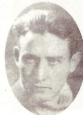
Ultima fotografie înainte de arestare