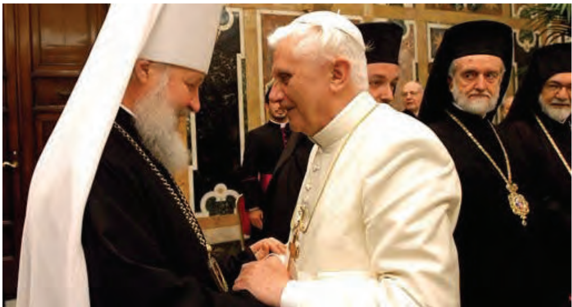
Mitropolitul Chiril al Smolenskului și Papa Benedict XVI la Constantinopol, în noiembrie 2006.

mitropolitului Chiril, loctiitorul de patriarh.