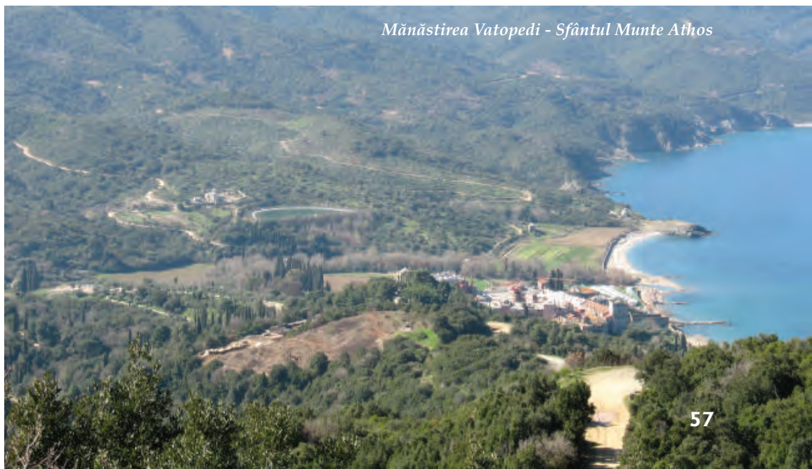
Mănăstirea Vatopedi - Sfântul Munte Athos

Cu adâncă tristețe, Sfânta noastră Mănăstire se vede silită să facă prezenta înștiințare. Cu un mare sentiment de responsabilitate, mai întâi față de