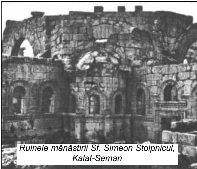
Ruinele mănăstirii Sf. Simeon Stolpnicul, Kalat-Seman

Încă de la întemeierea Noii Rome - Constantinopolului (între 324-330) - Imperiul Bizantin a început să exercite un rol covârșitor în procesul de creștinare a Europei, dar mai ales a regiunilor estice și sudice.