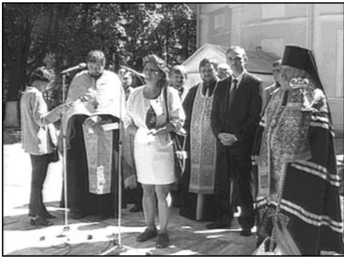
Secvență de la manifestările culturale din 31 august

Astfel, în această zi de sărbătoare au fost cinstiți de către urmași recunoscători cei ce