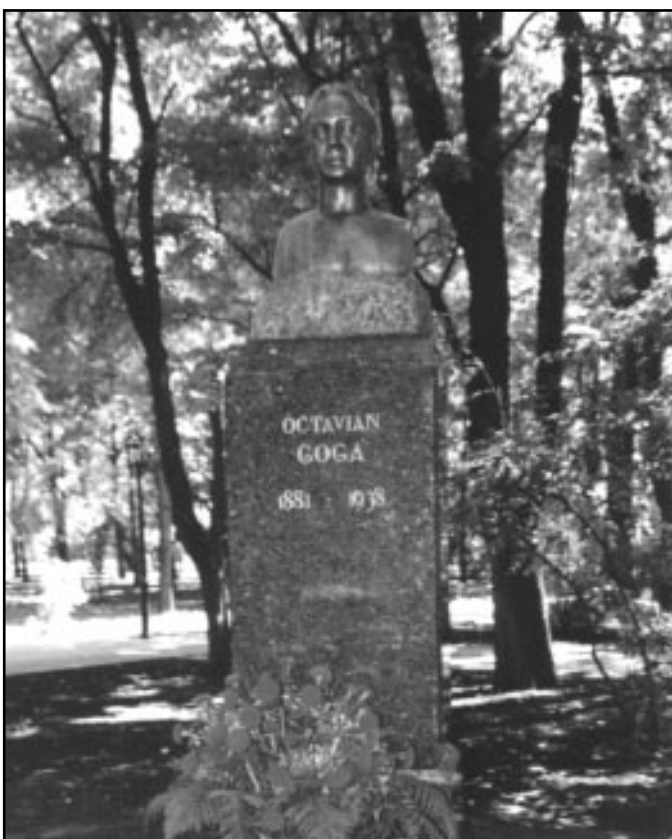
Bustul lui Octavian Goga