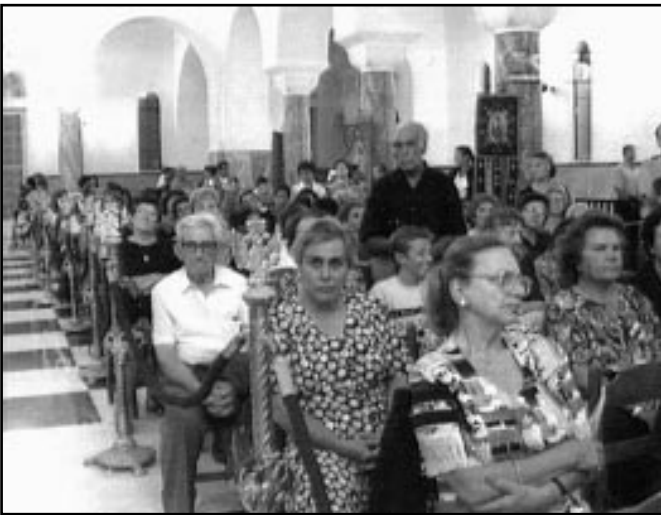
Serviciul divin în biserica "Sf. Gherasim" din Tesalonia

Mergând cu autobusul, sau ca alt mijloc de transport, veți observa numaidecât pe marginea șoselei la fiecare kilometru câte o cutie în forma unei biserici, în ea se află lumânări. Astfel fiecare trecător se poate opri în acest loc să aprindă câte