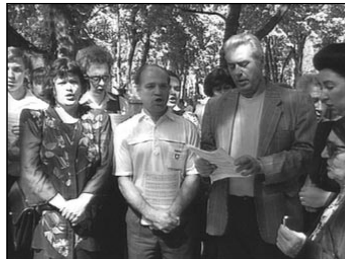
Corul bisericii “Sf. Nicolae” din Chișinău la sfințirea crucii de pe mormântul diaconului Alexandru Cristea

La momentele comemorative dedicate sărbătorii “Limbii Române” a fost prezent dl. Ministru al Culturii, Ghenadie Ciobanu.