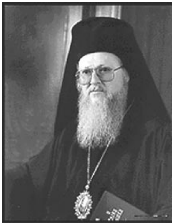
Preafericitul Bartolomeu I, Patriarhul Bisericii Ecumenice