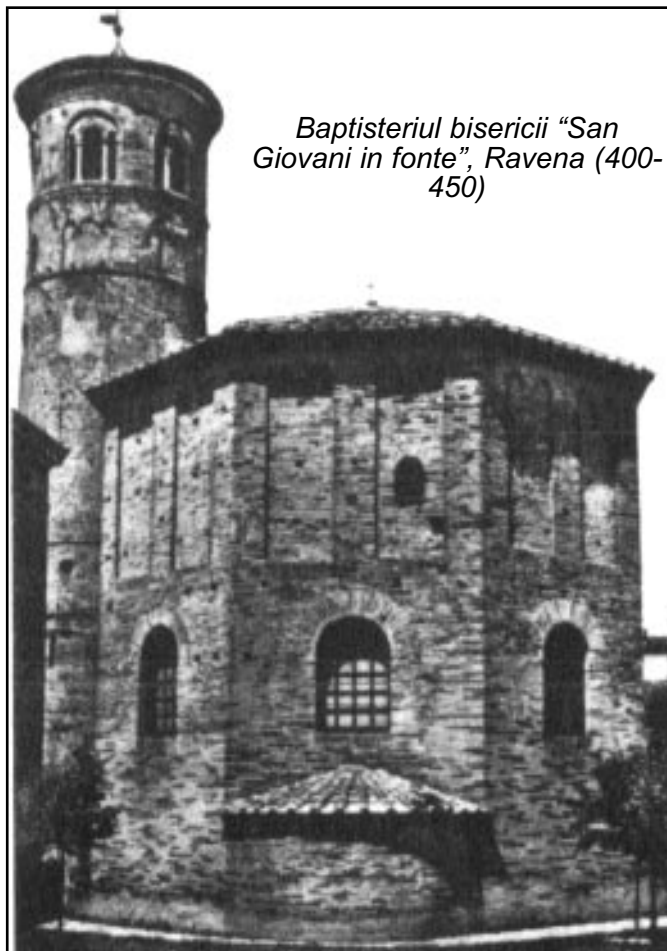
Baptisteriul bisericii "San Giovanni in fonte", Ravenna (400-450)

Din cea mai veche Notitia cunoscută a lui