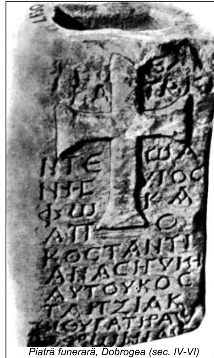
Piatră funerară, Dobrogea (sec. IV-VI)

încreștinării se înregistrează și în rândurile populației barbare din interiorul și exteriorul Imperiului.